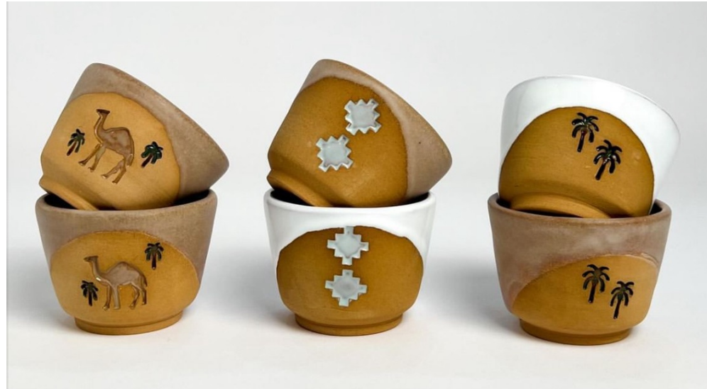
فنجال بنقش (نخلة - سحو - جمل)