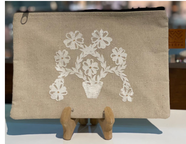
السعر: 95 ر.س