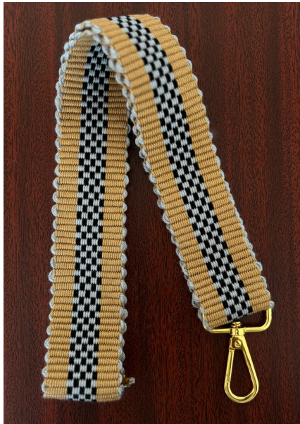
السعر: 245 ر.س - الطول: 47 سم - العرض: 4 سم