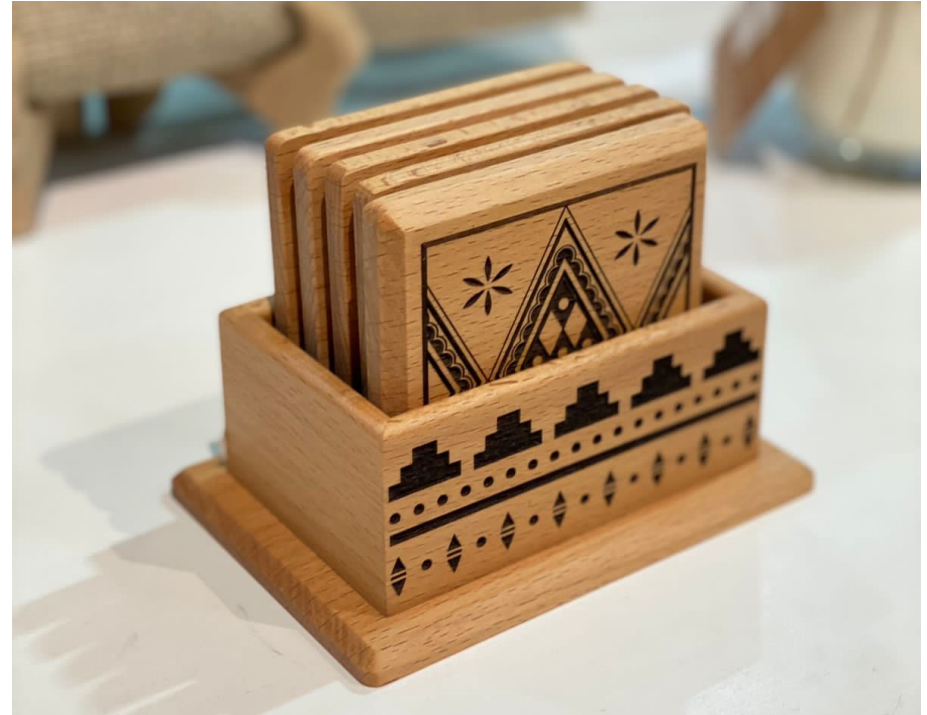
قاعدة أكواب خشبية بنقوش تراثية