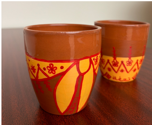
كوب فخار برسـم المنديل العسيري