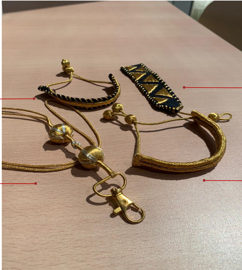
اسواره زري ذهبي وأسود 13*2 cm (قابلہ للتوسيع) 115 ر.س