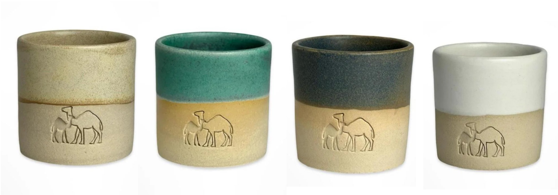
كوب عام الإبل