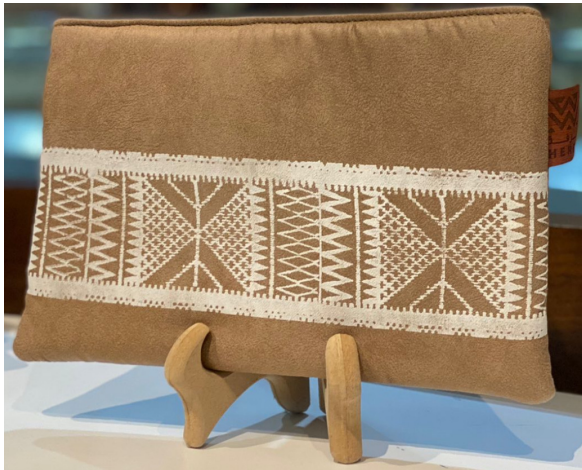
السعر: 165 ر.س