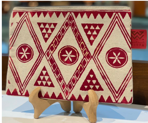
السعر: 95 ر.س