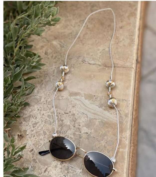
سلاسل نظارات مصنوعة من الزري بيد حرفي بارع، باللون الذهبي والفضي