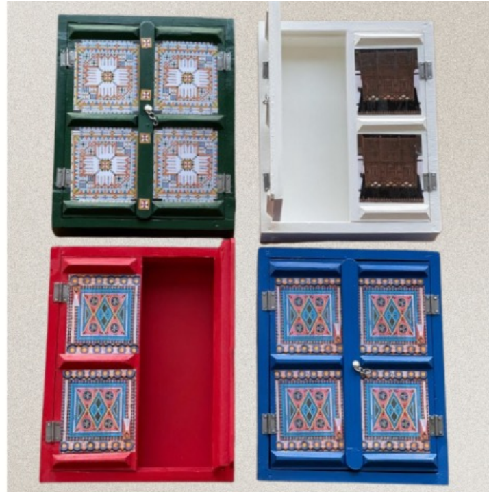
صندوق خشبي بتصميم الأبواب النجدية - دفتين