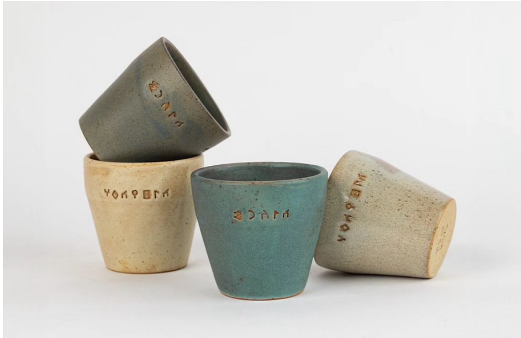
كوب قيم السعودية