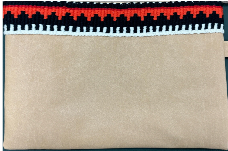
حقيبة يد من الجلد مزينة بشريط سدو السعر: 355 ر.س