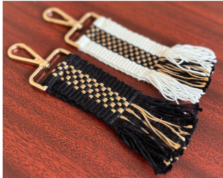
السعر: 66 ر.س - الطول: 17 سم - العرض: 4 سم