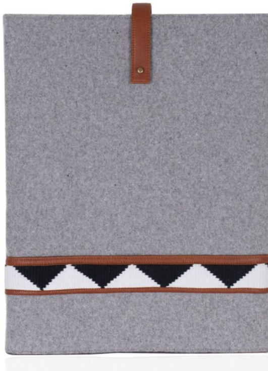
حقيبة لابتوب من الجوخ مزينة بشريط سدو السعر: 475 ر.س