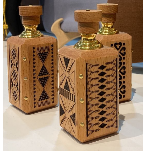
تولة عود خشبية بنقوش متعددة