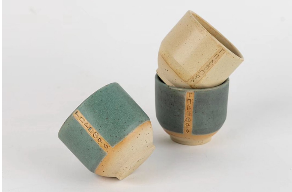
كوب جبل طريف