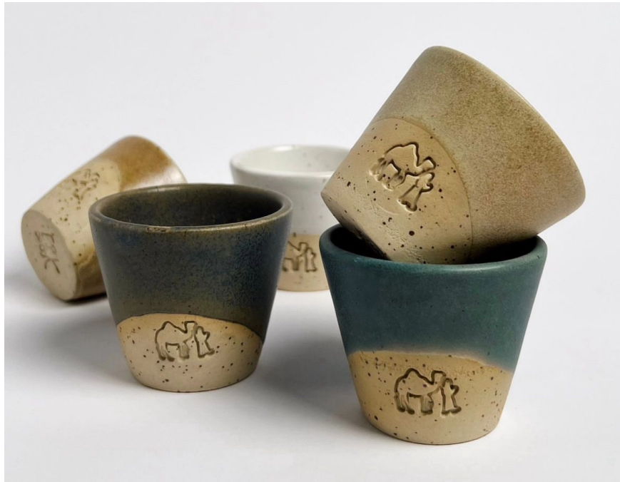
فنجال عام الإبل