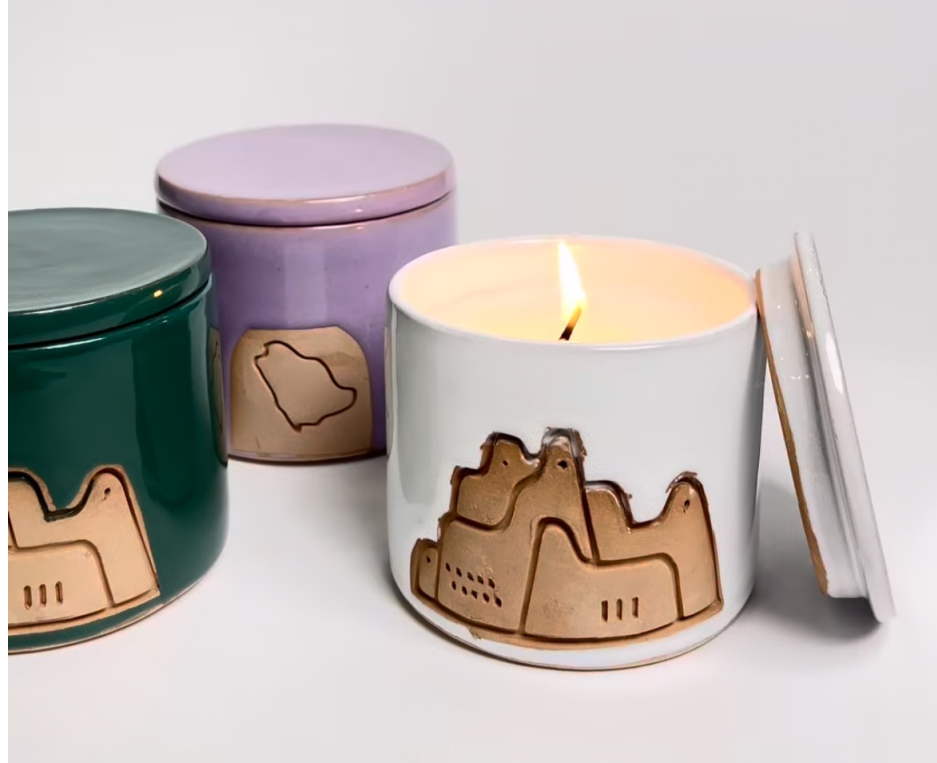
شمعة قصر سلوى