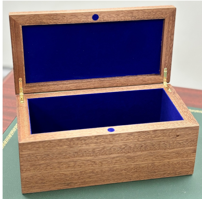
صندوق خشبي بتصميم الأبواب النجدية