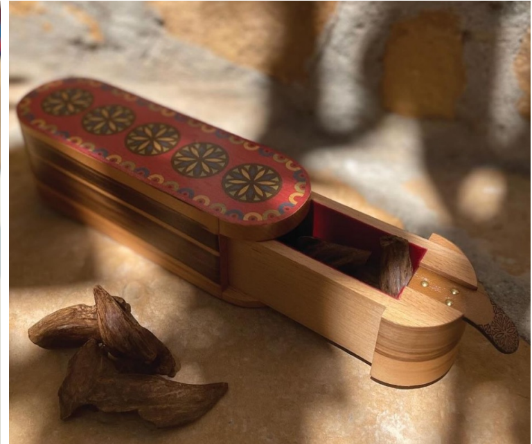
صندوق خشبي بنقوش تراثية *يمكن توفير بخور فاخر داخل الصندوق