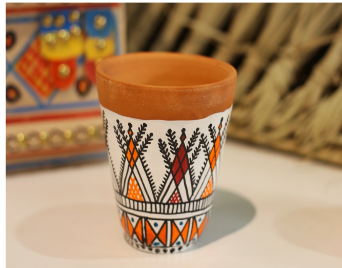
كوب فخار أبيض بنقش قط عسيري