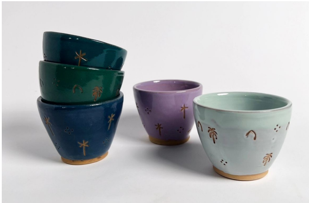
كوب يوم التأسيس